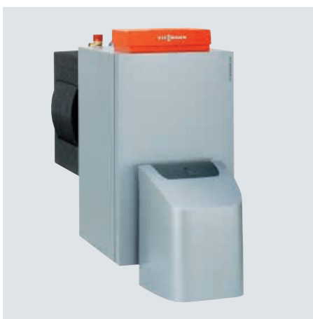
Vitorondens 200-T de 67,6 à 107,3 kW